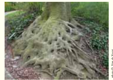
Les racines (ici d'un hêtre) ont aussi leur écorce.

L'écorce n'existe que chez les plantes ligneuses (arbres, arbustes, arbrisseaux... et certaines lianes), à durée de vie longue. Elle recouvre tronc, branches, mais aussi racines .