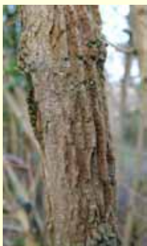
Toutes les écorces forment du liège (en tant que tissu) ; chez l'érable champêtre Acer campestre , il évolue en hautes crêtes.

Chaque (fragment de) périoderme comporte une assise génératrice qui produit vers l'extérieur des cellules qui, emmagasinant dans leur paroi de la subérine (mélange complexe d'esters d'acides gras et de phénols), finissent par mourir et se remplir d'air.