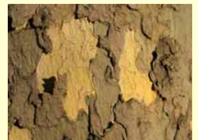
Le rhytidome écailleux du platane Platanus sp. se détache spontanément par grandes plaques.

Les couches mortes forment le rhytidome , qui se détache peu à peu (généralement par lanières si le périoderme est annulaire, par plaques plus ou moins grandes s'il est de type écailleux).