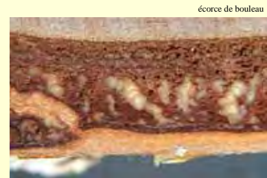
écorce de bouleau